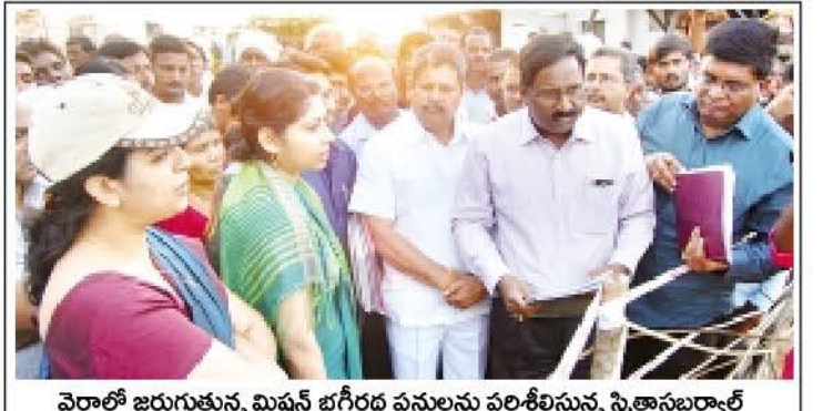
వైరలో జరుగుతున్న మిషన్ భగీరథ పనులను పరిశీలిస్తున్న స్థితానంద్

కాంట్రాక్టర్, అధికారులకు ముఖ్యమంత్రి కార్యాలయ అదనపు కార్యదర్శి స్థితానంద్ ఆదేశం వివిధ ప్రాంతాల్లో జరుగుతున్న 'మిషన్ భగీరథ' పనుల పరిశీలన కనకగిరి ఎంఎల్ఎ డి.నిర్మలకు గ్రీన్ సిగ్నల్